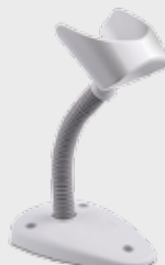
• STD-G040-WH: Basic Stand, G040, Weiß